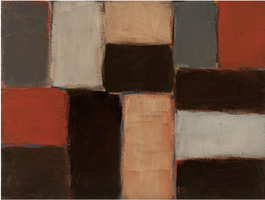
Barcelona Dark Wall, 2004