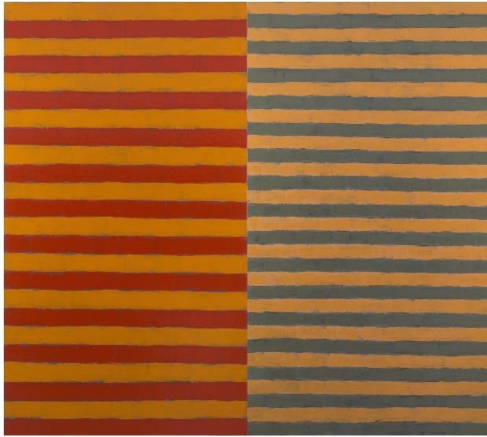
Tin Mal , 1997

IVAM Institut Valencià d'Art Modern, Generalitat